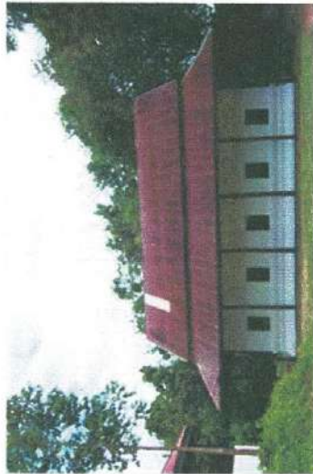
โบสถ์แบบดั้งเดิม