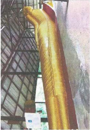
พระพุทธรูปปางไสยาสน์อายุไม่ต่ำกว่า ๒๐๐ ปี