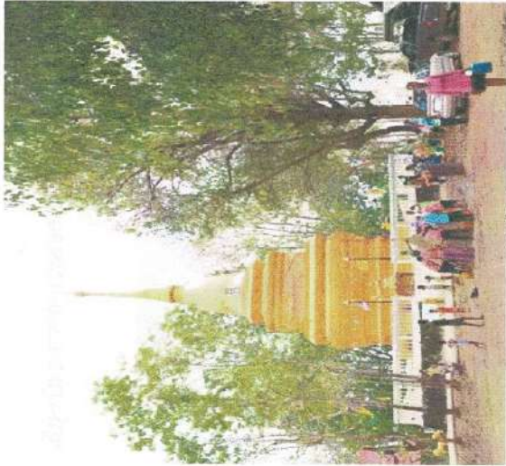
เจดีย์ศักดิ์สิทธิ์